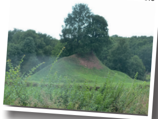
Motte de Presle

Au pied de cette motte à droite, était édifée une chapelle démolie peu avant 1800 et un cimetière. Sur le sommet une tour où se réfugiait le seigneur sa famille et sa garde.