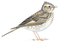
Alouette des champs

8 Le chemin vous ramène vers le bourg de Tranzault. Le plateau hésite aussi entre pâtures et cultures, ce qui permet au bruant jaune et à l'alouette des champs de trouver ici un espace pour nicher.