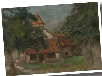
Tableau de Fernand Maillot. Collection du Musée George Sand à La Châtre

Construite vraisemblablement au XI ème siècle, l'église Sainte Anne dépendait de l'abbaye bénédictine de Déols. Son originalité réside dans l'auvent en appentis, appelé caquetoire, lieu de conversation ou guenillère, ainsi qu'abris pour les mendiants. On peut admirer des chapiteaux naïfs et des peintures murales découvertes récemment. C'est ici même que l'enterrement de George Sand fut officié le 8 juin 1876.