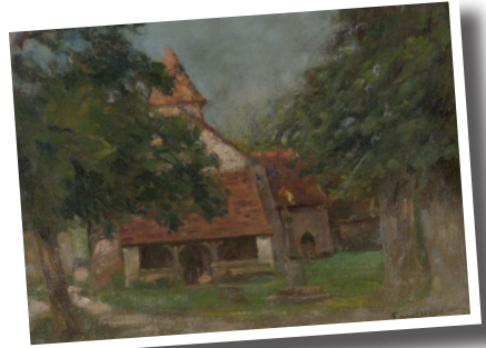
Tableau de Fernand Maillot. Collection du Musée George Sand à La Châtre

Construite vraisemblablement au XI ème siècle, l'église Sainte Anne dépendait de l'abbaye bénédictine de Déols. Son originalité réside dans l'auvent en appentis, appelé caquetoire, lieu de conversation ou guenillère, ainsi qu'abris pour les mendiants. On peut admirer des chapiteaux naïfs et des peintures murales découvertes récemment. C'est ici même que l'enterrement de George Sand fut officié le 8 juin 1876.