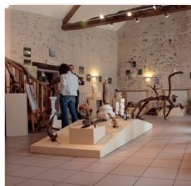
Musée des Racines - Place de l'église - ThevetSt-Julien

Réalisé par le service tourisme de la Communauté de Communes La Châtre / Ste Sévère Renseignement : 02 54 48 22 64 Fiches à télécharger sur le site www.pays-george-sand.fr