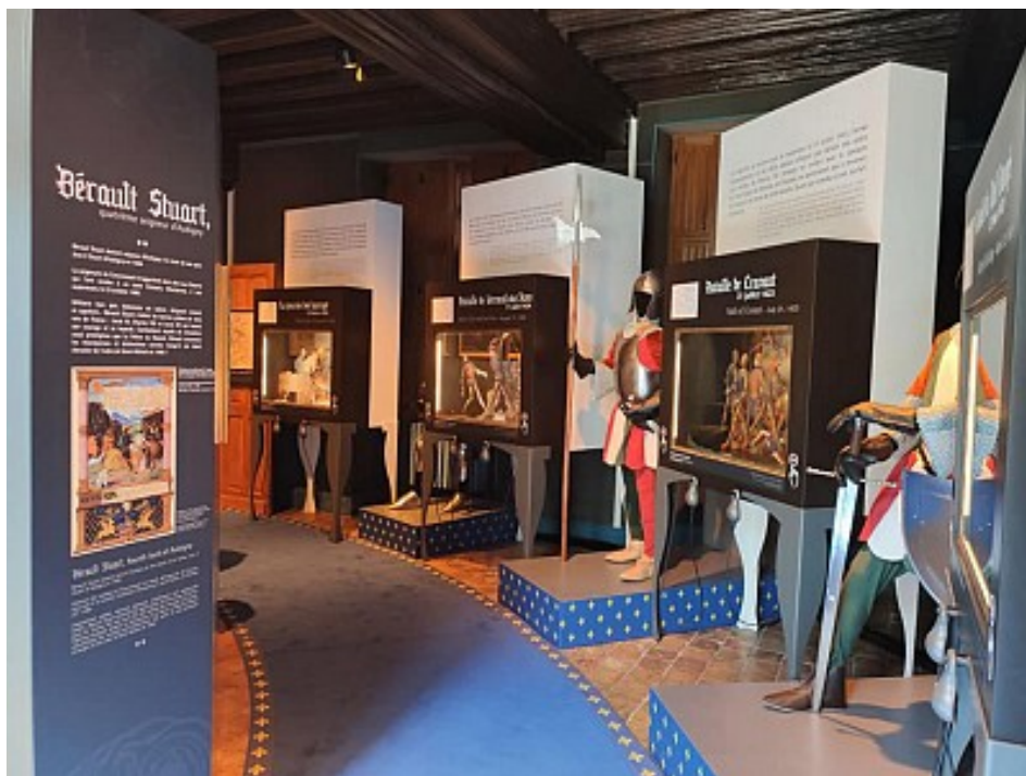
Office de Tourisme Saultre et Sologne

Le Centre d'Interprétation de l'Auld Alliance vous propose de revivre les heures épiques de l'union Franco-Ecossaise. Situé au rez de chaussée du Château des Stuarts, apprenez et perfectionnez vos connaissances sur l'histoire qui lie Aubigny à l'Ecosse par cette visite ludique et interactive.