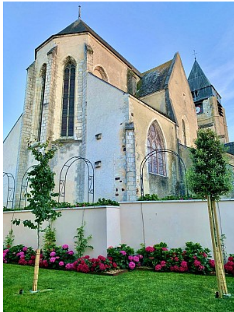
Office de Tourisme Sauldre et Sologne

Cette église est attestée dès le IX ème siècle, elle est dédiée à Saint-Martin (évêque de Tours au 4 ème siècle). Durant la guerre de cent ans, l'église fut incendiée par les anglais à 2 reprises (en 1356 puis en 1412). Les chapelles latérales et le chœur ont été édifiées par Robert Stuart, suite à l'incendie de 1512. Une clé de voute porte ses armoiries et pourrait être datée des années 1517-1527.