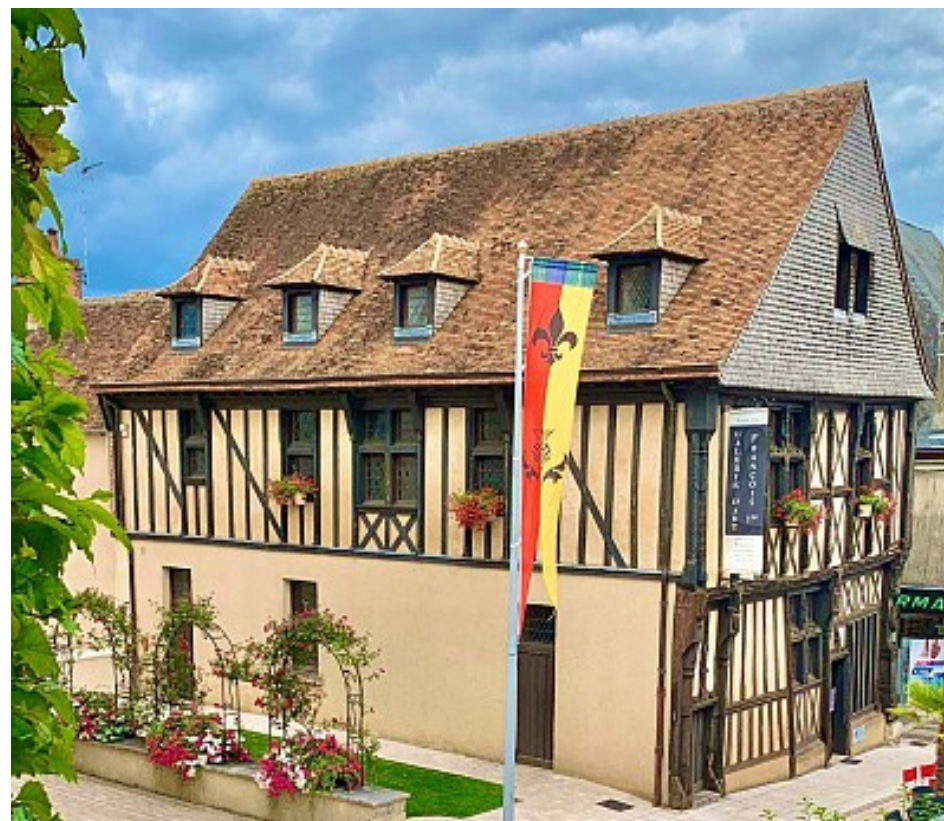
Office de Tourisme Saultre et Sologne

L'une des plus belles et anciennes maisons d'Aubigny-sur-Nère, construite en 1519 suite au terrible incendie qui ravagea la ville en 1512. Elle abrite désormais la Galerie François 1er, aux expositions thématiques variées.