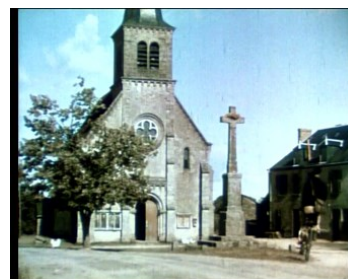
Scène du carillonneur Église de Pouigny Notre Dame (Indre)