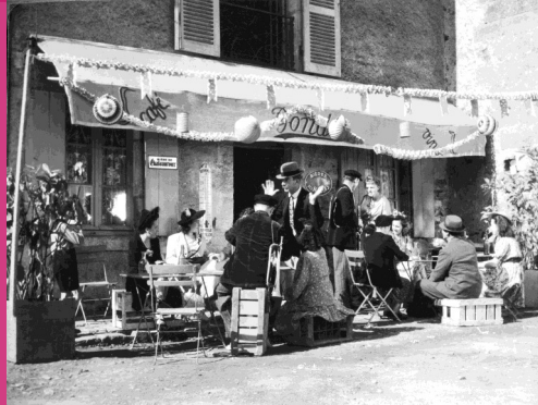
« Café Banou »