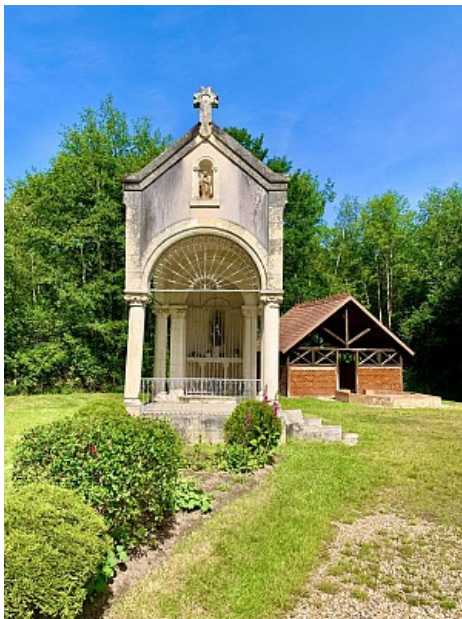
OT Sauldre et Sologne

Montaine est depuis devenue la Sainte-patronne de la Sologne.