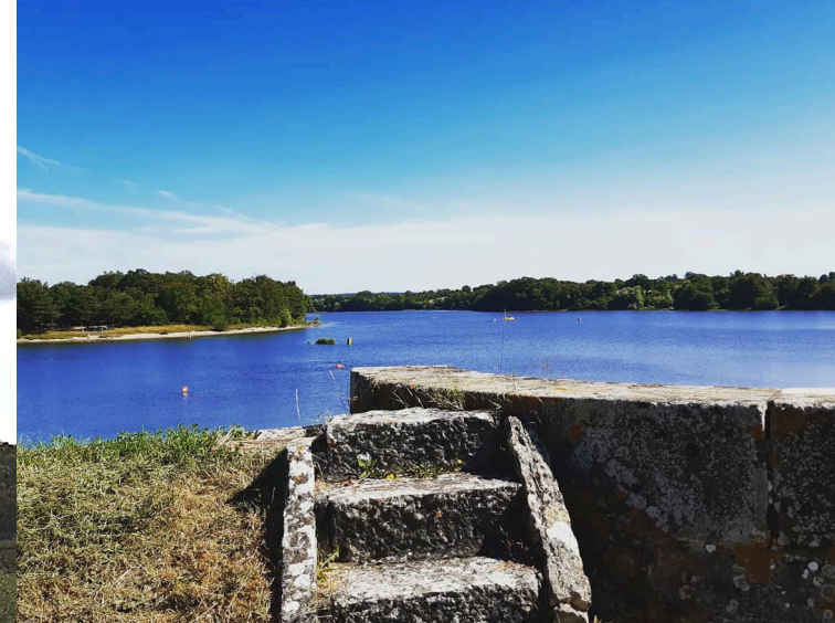
Étang de Goule