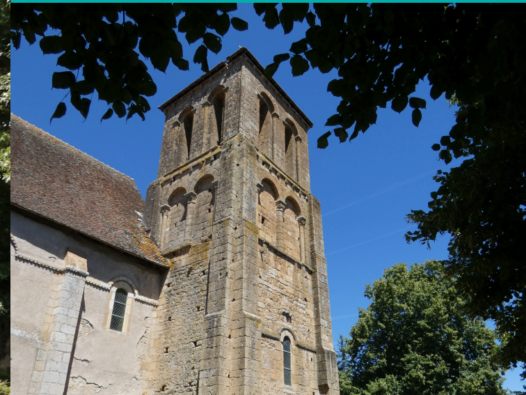
La Marmande à Charenton-du-Cher