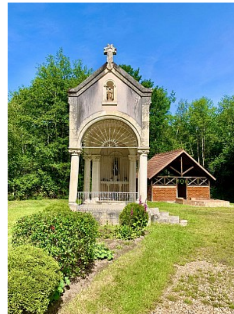
OT Sauldre et Sologne

Montaine est depuis devenue la Sainte-patronne de la Sologne.