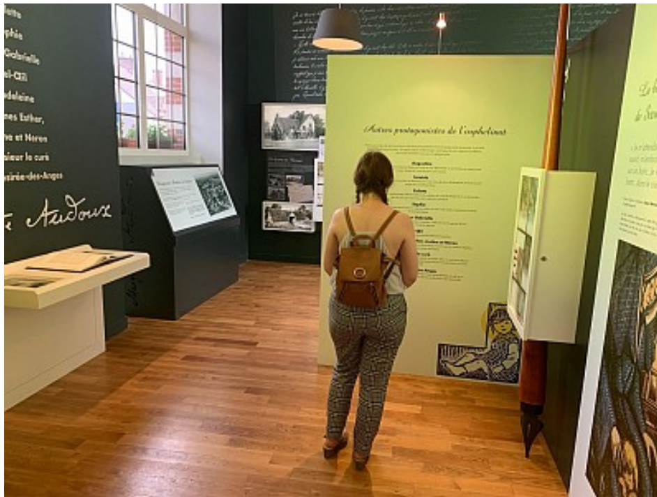
OT Sauldre et Sologne

Une bergère orpheline qui devient couturière avant de connaître la gloire littéraire (Marie-Claire, prix Fémina 1910): Marguerite Audoux (1863-1937) a connu un destin étonnant, que son musée retrace sur 240 mètres carrés, avec une toute nouvelle scénographie.