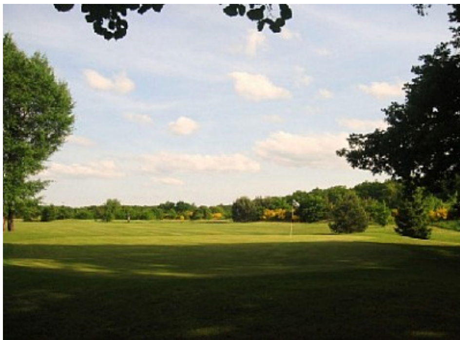
Golf de Nançay

Ouvert toute l'année. Pour consulter les jours et horaires d'ouverture : https://www.golfdenancaysologne.com/