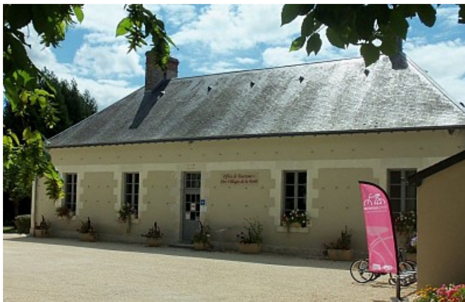
Mairie de Nançay

Retrouvez toutes les informations touristiques au www.aubigny-sologne.fr .