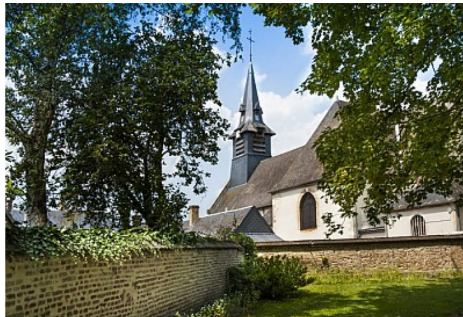
Mairie de Nançay

L'église paroissiale se trouvait, au XVI ème siècle, « au midi du château » ; en 1624 Henri La Châtre, alors comte de Nançay, fait requête à l'archevêque de Bourges pour obtenir son déplacement ; il se plaint en effet d'être « incommodé par les sonneries continues des cloches » ; sa requête est acceptée (10 avril 1624) ; il échange alors les terrains où se trouvent l'église et le presbytère actuels avec ceux qu'ils occupaient alors. Le 9 juin 1893, l'église est détruite par un incendie causé par la foudre. Elle est alors reconstruite l'année suivante telle qu'elle est, avec sa voûte de chêne réalisée par M. Fonteny, de Salbris. Elle fut ensuite restaurée de 1950 à 1958.