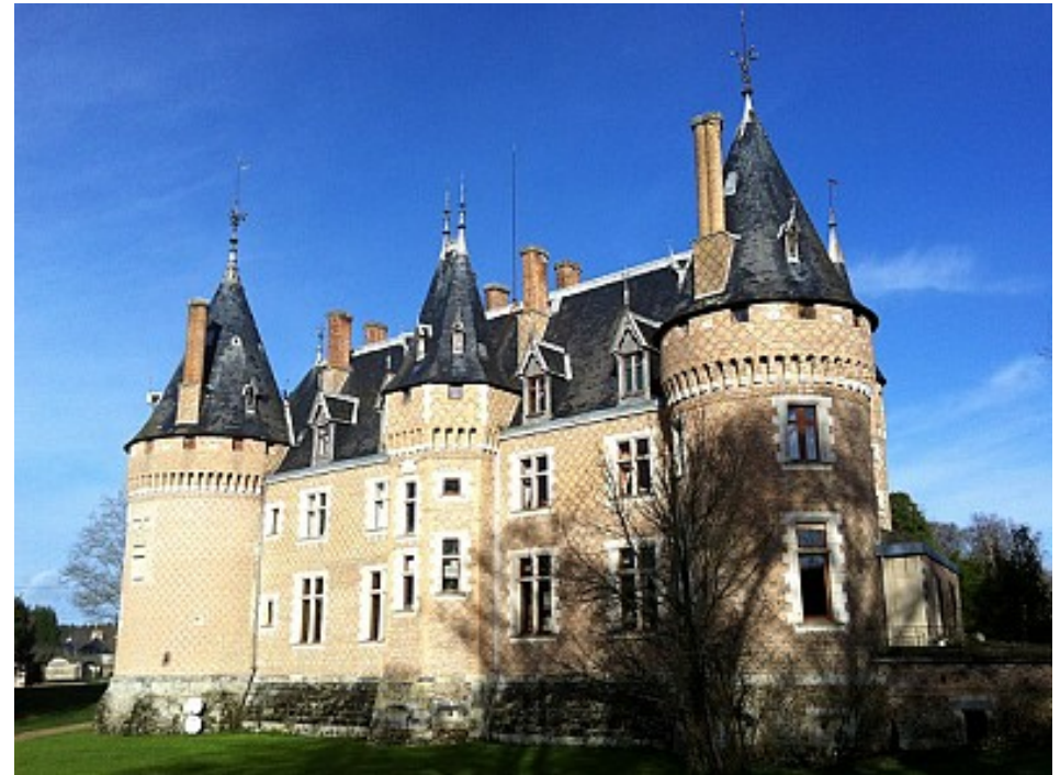
Château de Nançay

Le parc du Château de Nançay est ouvert gratuitement à la visite de fin août à fin septembre. Le château a été fortifié par Jean de la Châtre au XV ème siècle puis d'importantes restaurations ont eu lieu en 1850 par Léon Pépin Lehalleur.