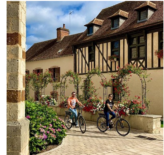
OT Sauldre et Sologne