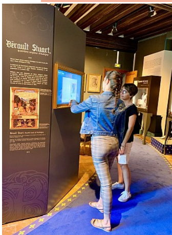
OT Sauldre et Sologne

Château, Eglise & Abbaye, Histoires et Légendes, Activités Culturelles