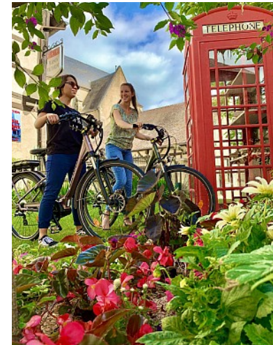
OT Saultre et Sologne