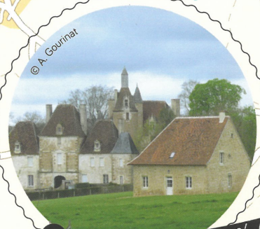
Le Chateau du Châtelier