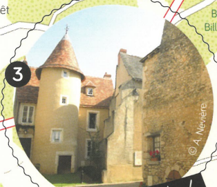
3 Le bourg médiéval