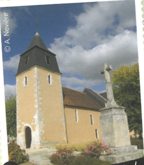
6 L'Eglise Saint-Martin