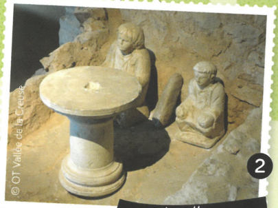
2 Autel gallo-romain