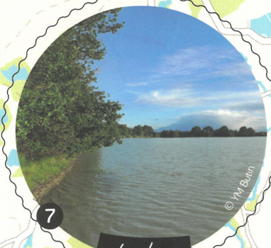
7 Les étangs