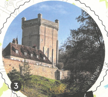
3 Le donjon de Prunget

Entre Velles et Tendu, la Bouzanne serpente entre prairies et coteaux boisés. Cet écrin de verdure attire depuis toujours et de nombreux châteaux se sont implantés sur ces rives. Certains datent du Moyen-Âge tels Prunget et Mazières. Les parcours à vélo sont plutôt faciles, juste un petit raidillon du côté de Prunget.