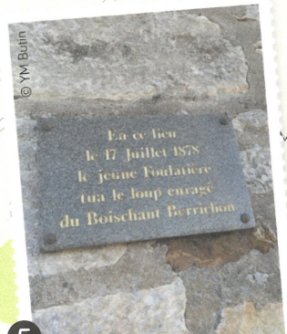
5 Le loup enragé de Tendu Mosnay